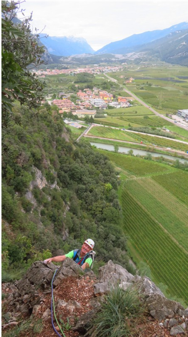
Uscita quarta lunghezza