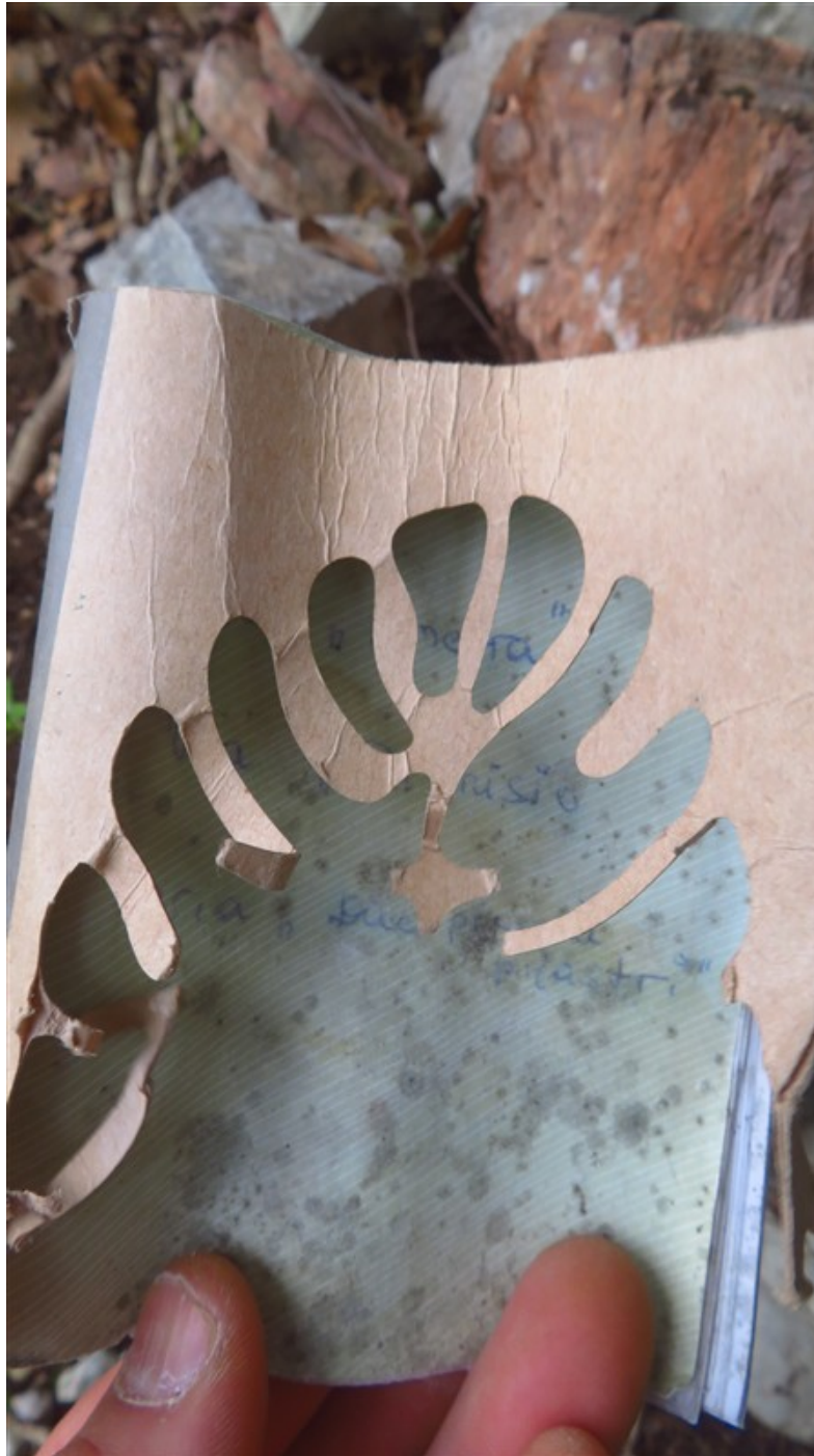
Libro di via