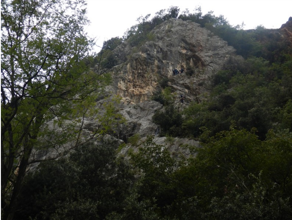
Cordata impegnata nell'ultimo tratto della via