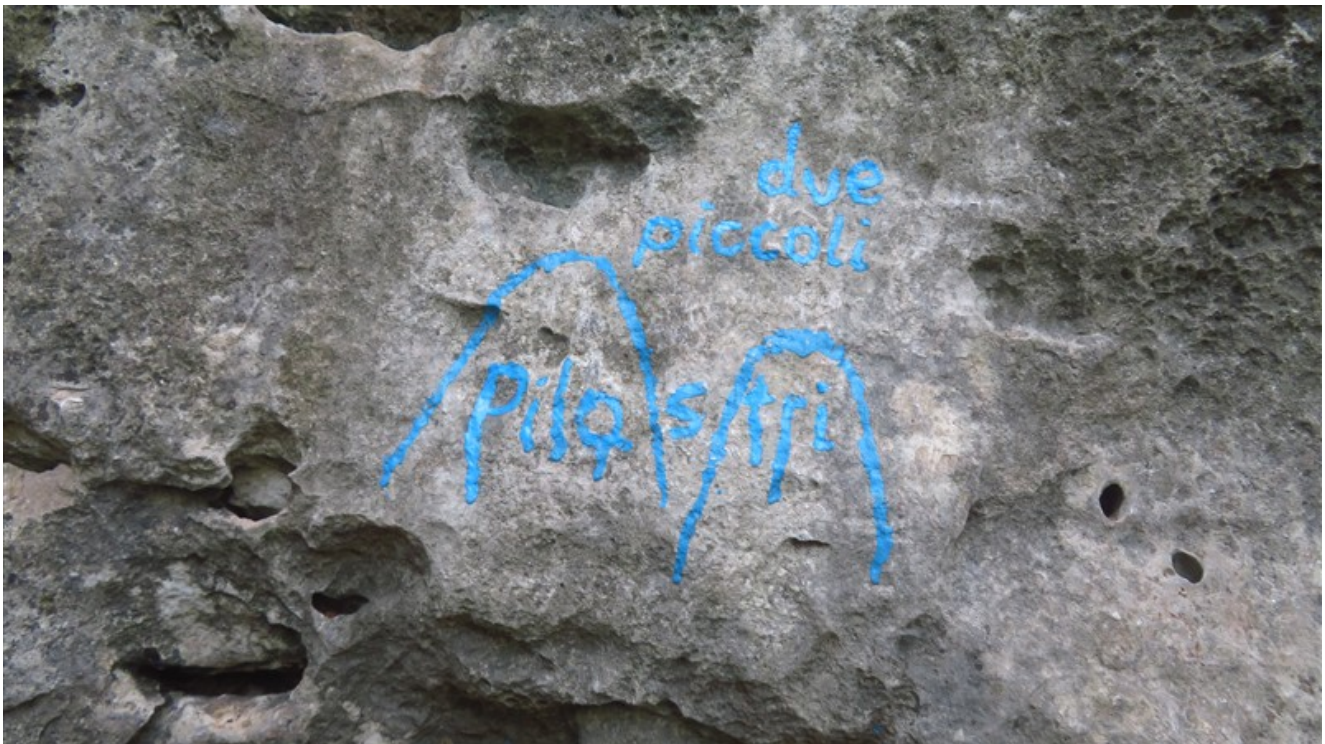
Attacco della via