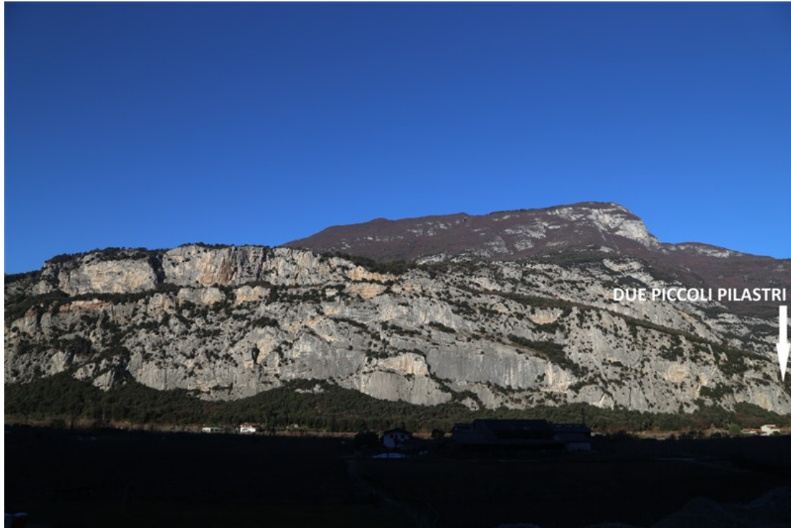
Parete di San Paolo. La via sale all'estrema destra della parete