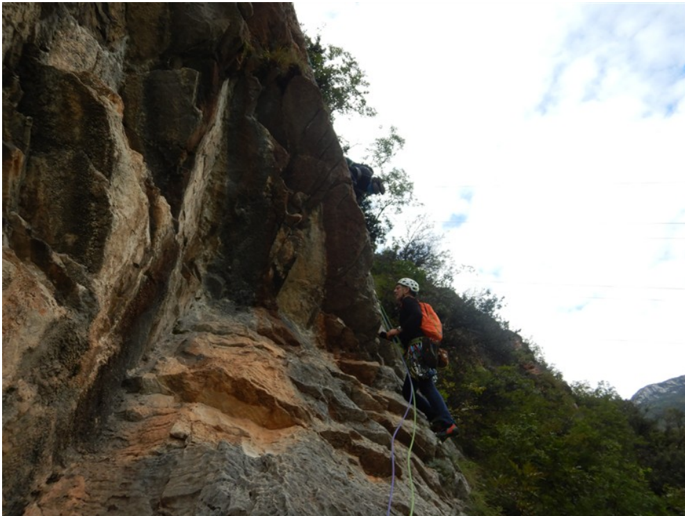
Partenza quarta lunghezza