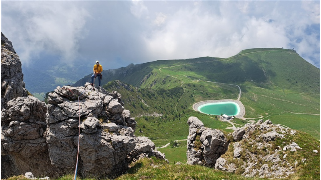
Pietro in uscita dall'ultima lunghezza