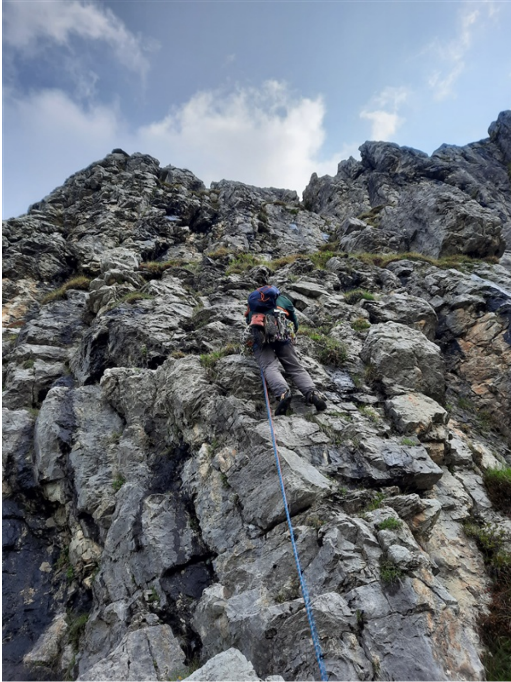
In apertura sulla prima lunghezza