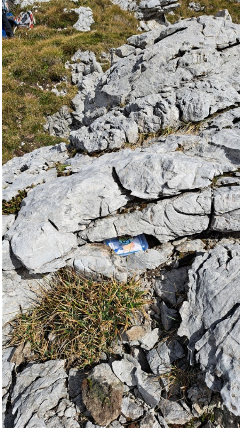
Libro di via