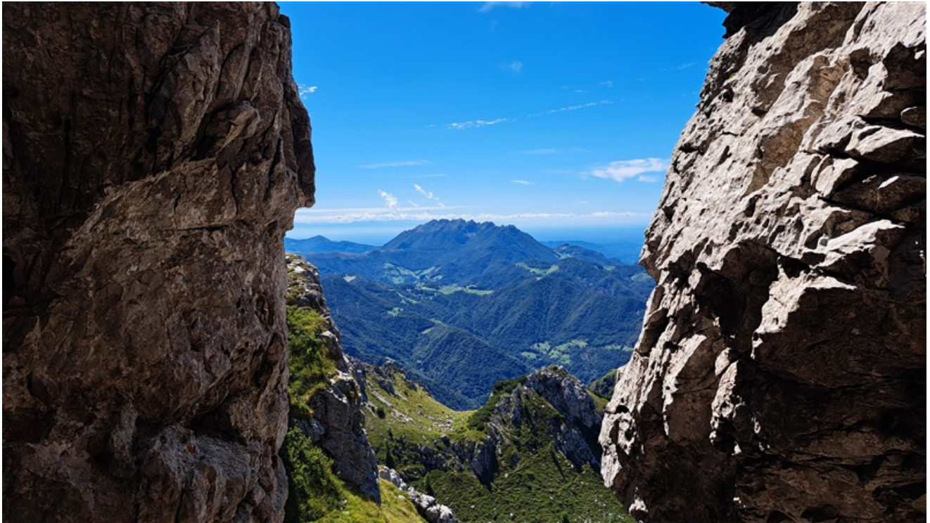
Panorama dalla sosta al termine del quarto tiro