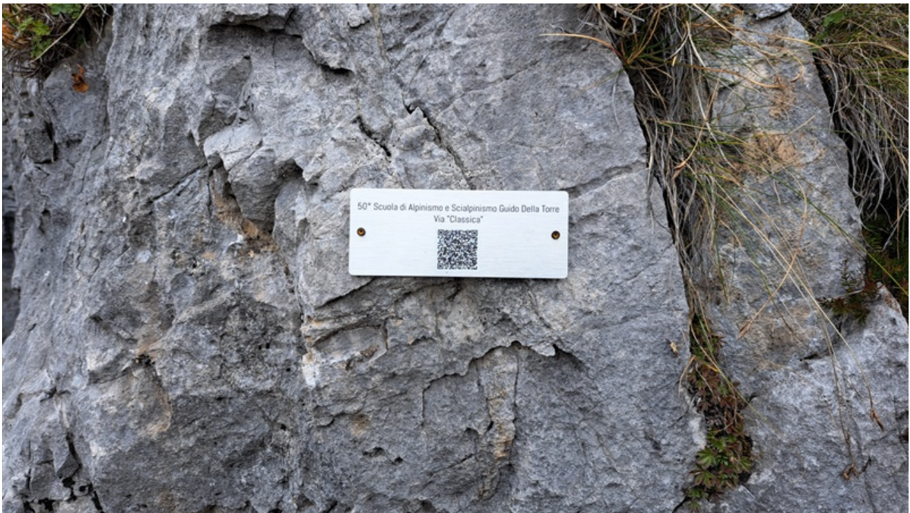
Attacco della via

Tracciato (molto) indicativo. A sx la via 'Classica', a dx la via 'Plaisir' (e in verde la calata in doppia da quest'ultima)