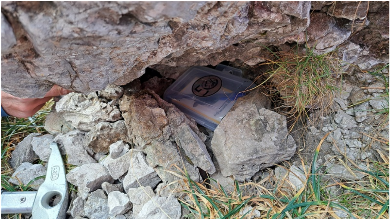
Libro di via