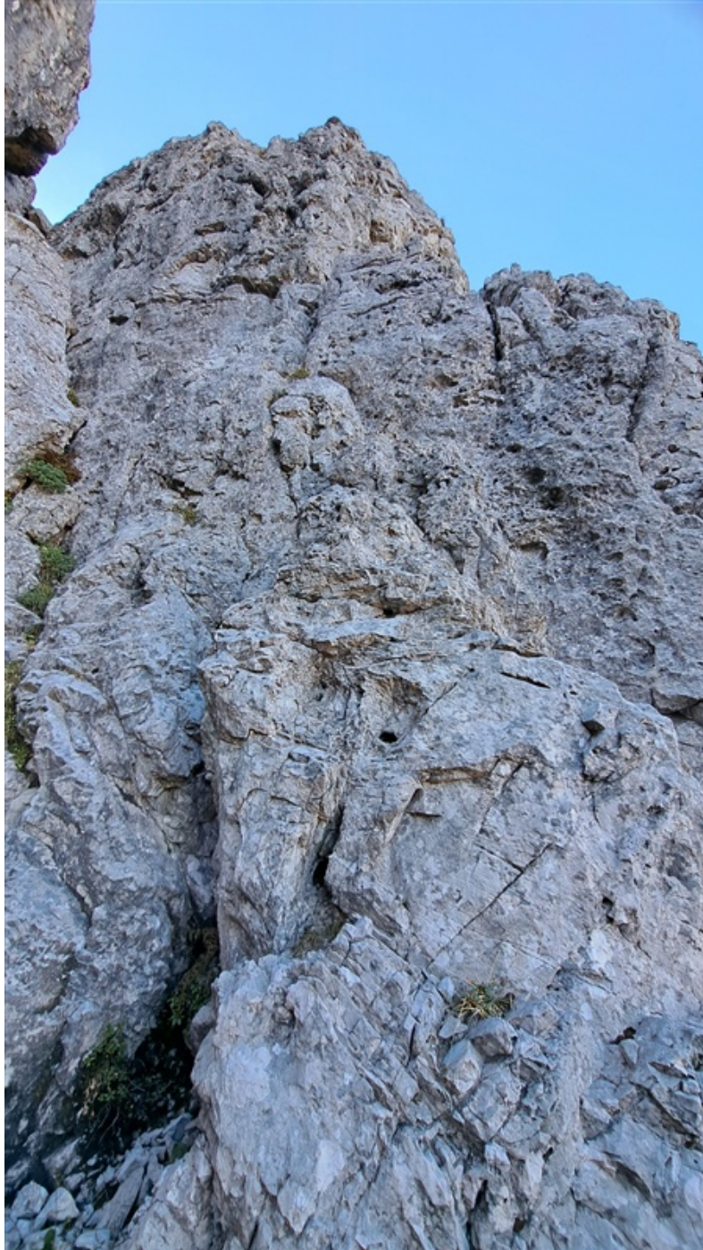
Attacco ultima lunghezza