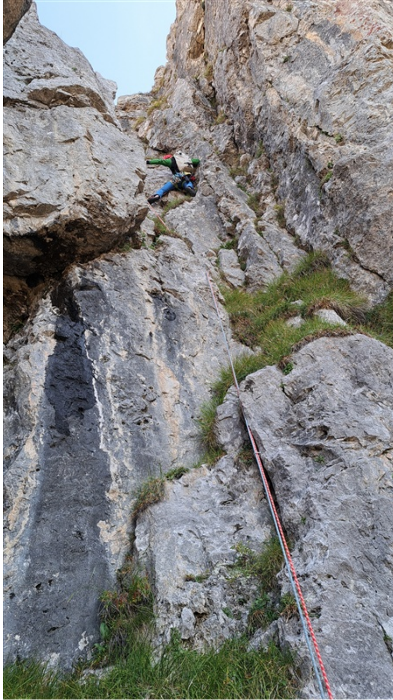
Claudio in apertura sulla seconda lunghezza