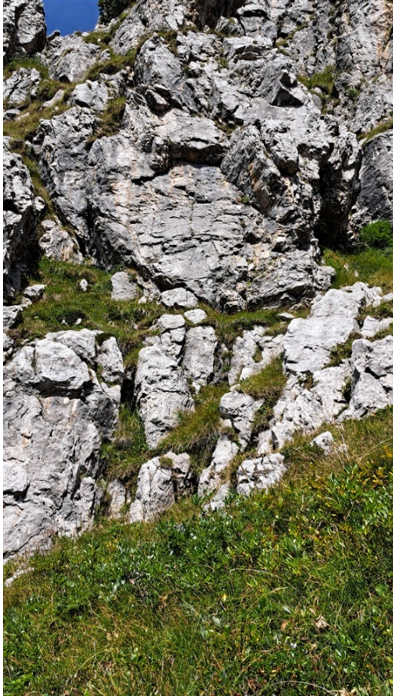
La bella placca della prima lunghezza