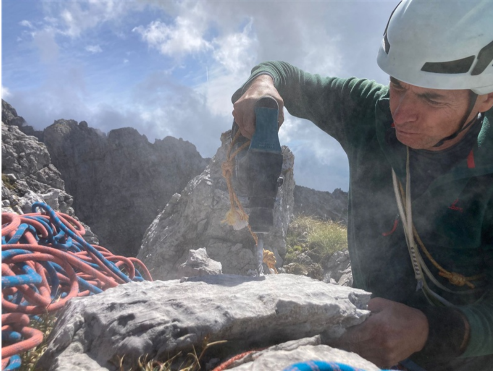
Attrezzatura di una delle soste della via