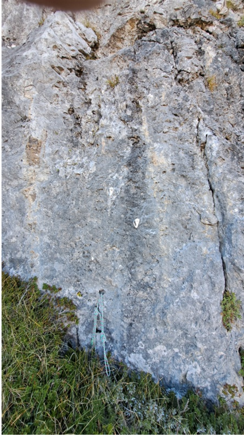
Secondo salto, attacco quarta lunghezza