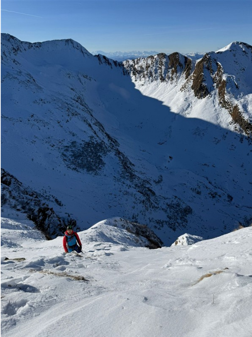
Uscita dalla cresta