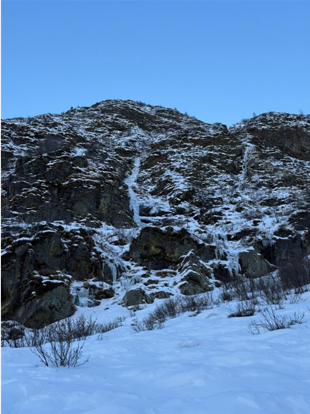
Attacco e linea