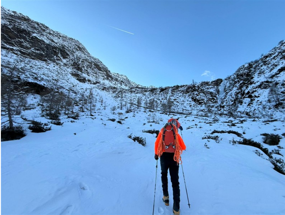
Avvicinamento, visibile la cascata centrale