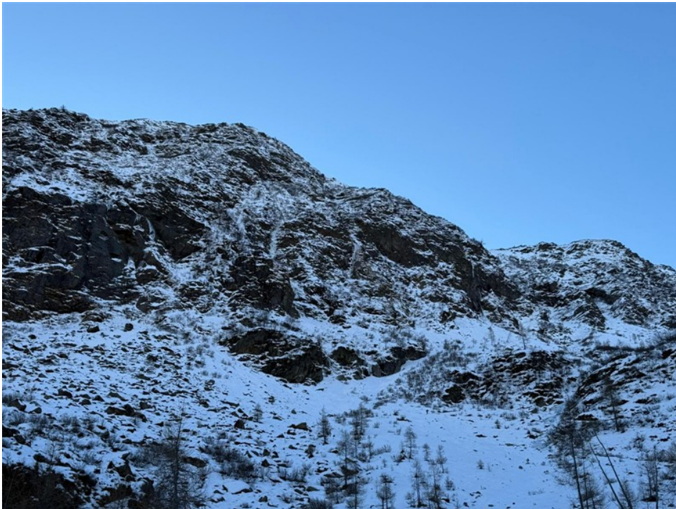
Linea di salita