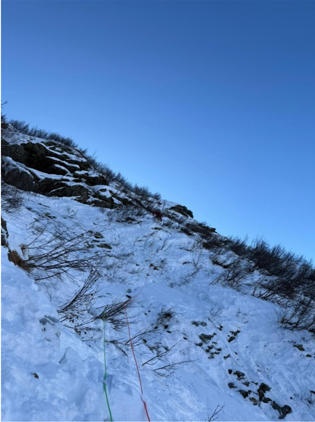
Traverso a destra finito il canale