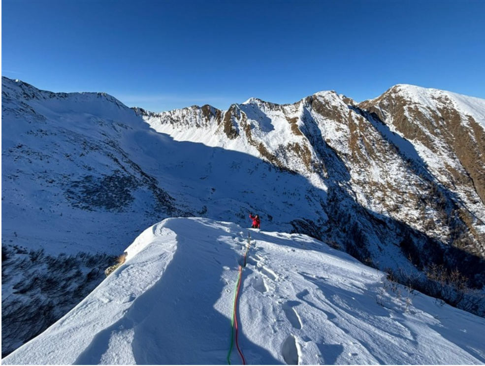
Uscita dal traverso sul filo di cresta