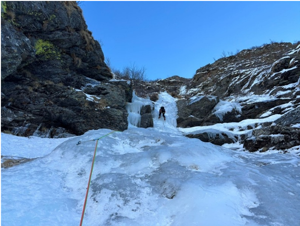
Muretto verticale del primo tiro