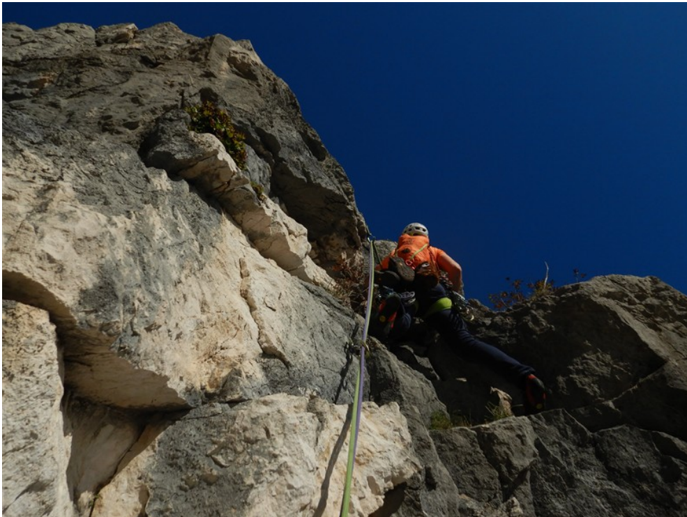
Partenza terza lunghezza