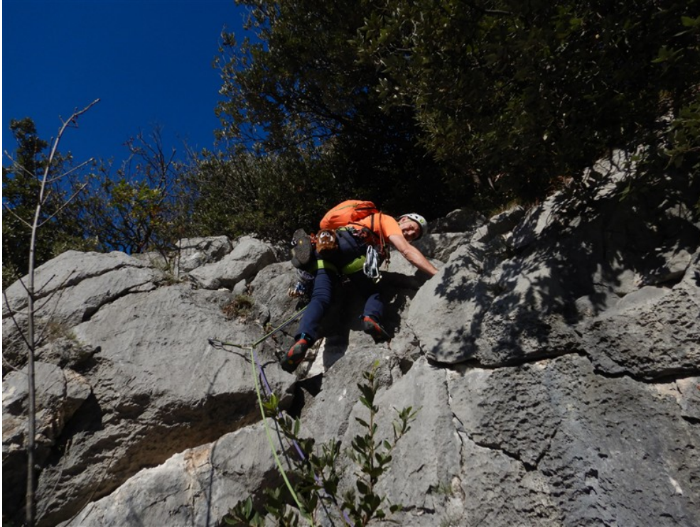
Partenza quinta lunghezza